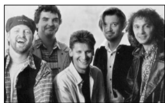
Pur spielt am Montag in Karlsruhe.

schenken möchte. Herzlichen Glückwunsch!