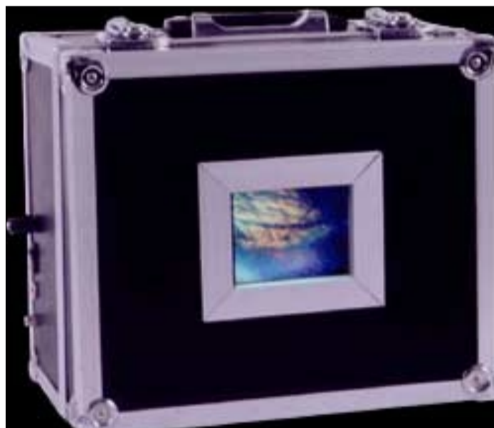
Der Koffer des Künstlers. Hier entstehen Tim Otto Roths Photogramme.

Tim Otto Roths in deutsch/englisch, französisch, spanisch japanisch erscheinendes »ballet – photo – grammatique« steht im Internet unter www.jenseits.net . Neben den gezeigten Photogrammen enthält es auch einen umfangreichen theoretischen Teil mit Erläuterungen und Erklärungen zur Bildwelt des Photogramms.